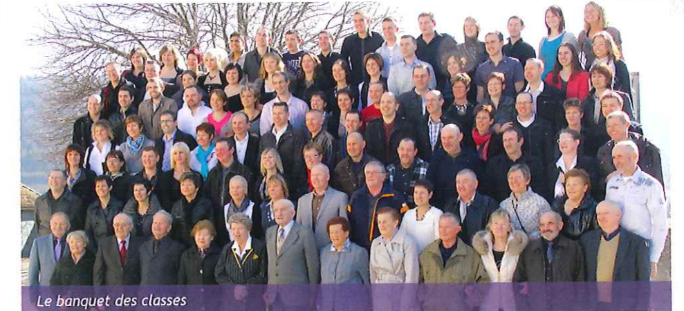
Le banquet des classes

Le traditionnel banquet des classes réunissant les années «1» et «6» a connu un vif succès cette année puisqu'il réunissait 101 participants venant d'horizons divers et tous heureux de partager un sympathique repas dans la salle des fêtes suivi d'une après-midi dansante. Tout s'est déroulé dans une ambiance conviviale, une grande partie se retrouvant le soir autour du dîner auquel étaient invités les conjoints.