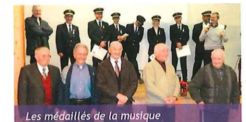
Les médaillés de la musique