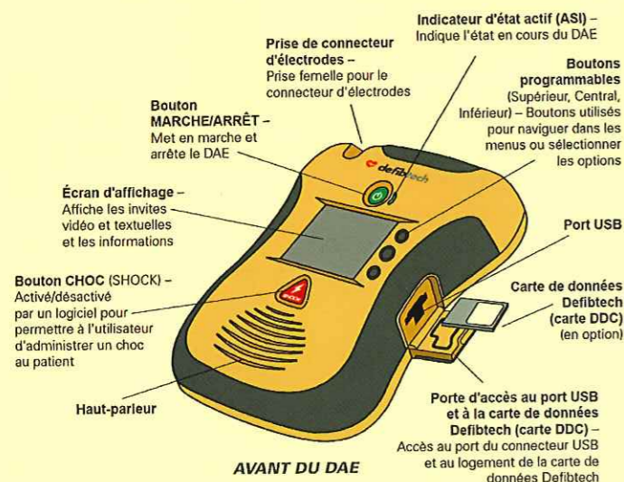
SCHÉMA DES COMPOSANTS