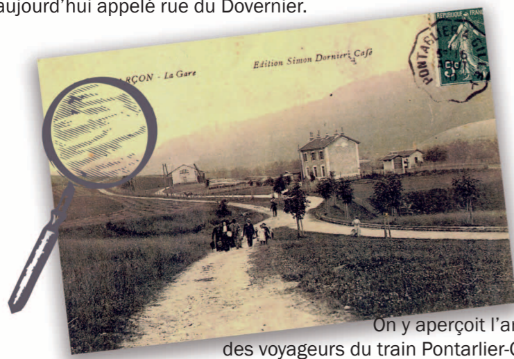
On y aperçoit l'arrivée des voyageurs du train Pontarlier-Gilley.

Ancien quartier de la gare, aujourd'hui appelé rue du Dovernier.