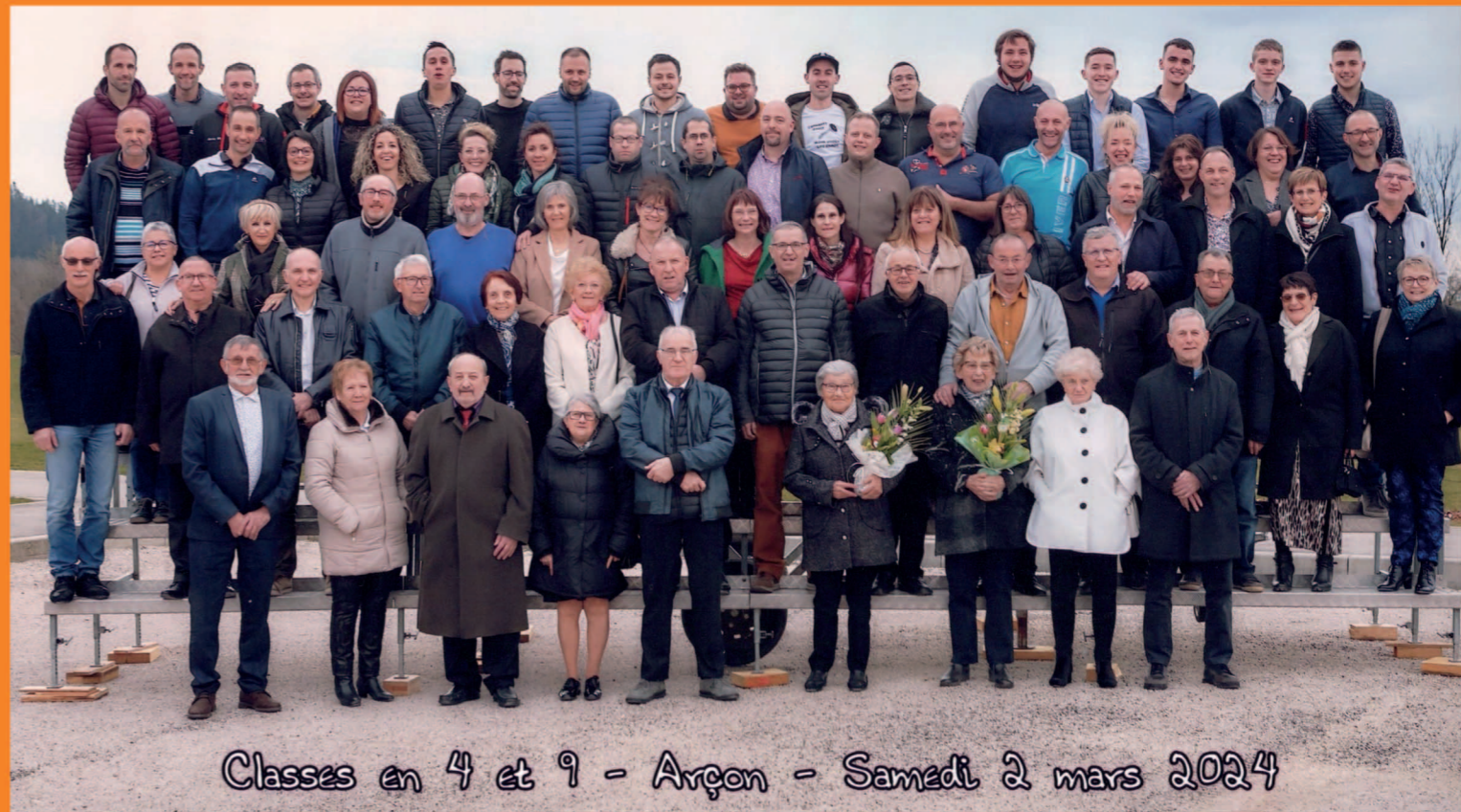
Classes en 4 et 9 - Arçon - Samedi 2 mars 2024